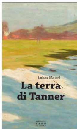
Lukas Maisel : La terra di Tanner

Depuis 1974, la Collection ch soutient la traduction d'ouvrages de littérature dans les différentes langues nationales en participant aux frais d'impression. Elle encourage ainsi les échanges littéraires par-delà les frontières linguistiques. La Collection ch compte aujourd'hui 338 ouvrages, parmi lesquels six nouvelles parutions.