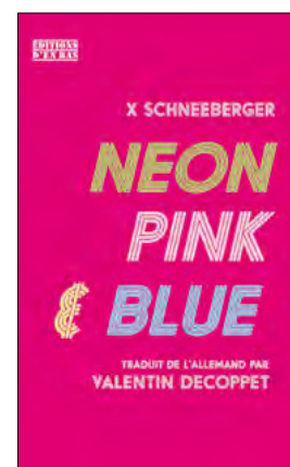
X Schneeberger : Neon, Pink & Blue