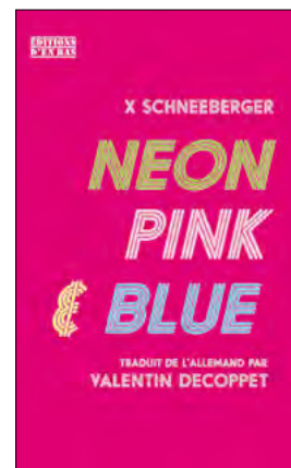
X Schneeberger: Neon, Pink & Blue